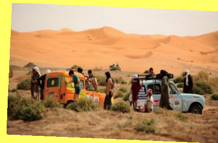
Association 4L Trop-filles